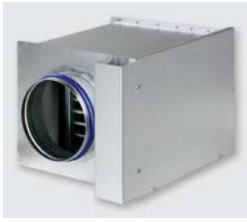
Batterie type WL