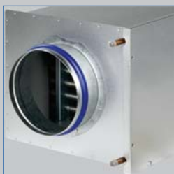
Batterie avec tubes en cuivre et ailettes en aluminium