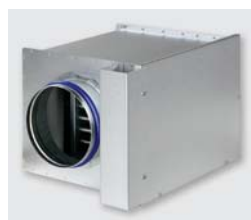
Batterie type WL