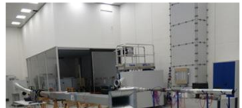
LES INSTALLATIONS D'ESSAI TECHNIQUE DE COMMANDE