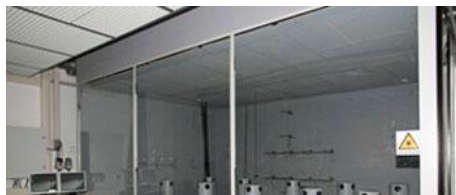
INSTALLATIONS D'ESSAI TECHNOLOGIE DE DISTRIBUTION D'AIR