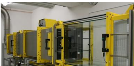
POUR LES PLUS HAUTES EXIGENCES TECHNIQUE DE FILTRATION