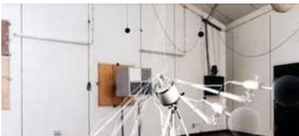
LES MESURES SUR LES ATTÉNUATEURS ACOUSTIQUES ACOUSTIQUE